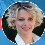
Premio Speciale BARBORA BOBULOVA